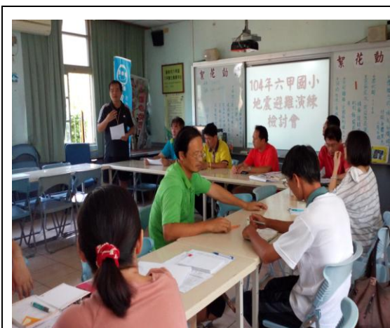
照片 19 說明：地震演練活動後進行檢討修正，針對幼稚園避難速度較慢，大家提供參考意見。