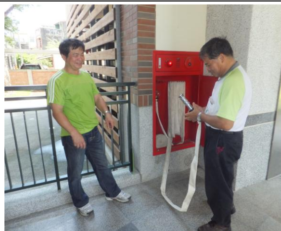
照片 22 說明：本校教職員工實施消防演練以增搜救避難經驗。