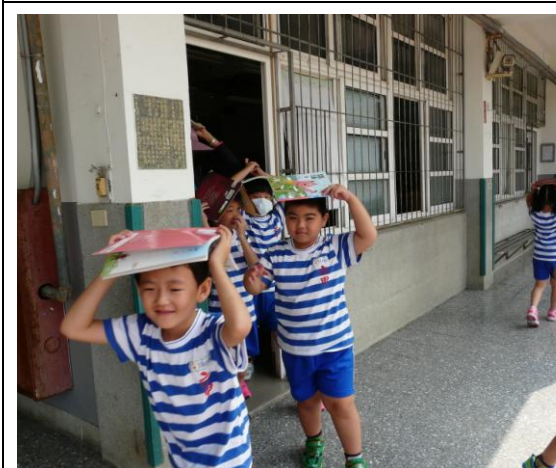
照片 21 說明：學生依避難要領迅速疏散，不語、不推、不跑。